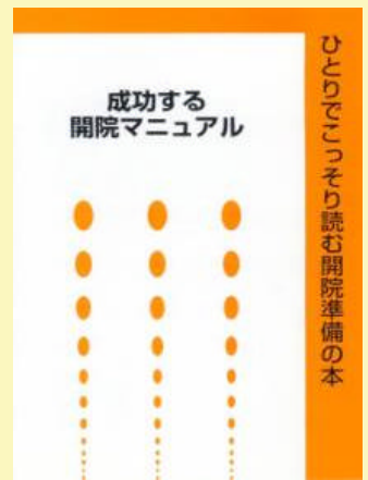
8 成功する開院マニュアル 500円