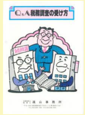
4 税務調査の受け方 500円