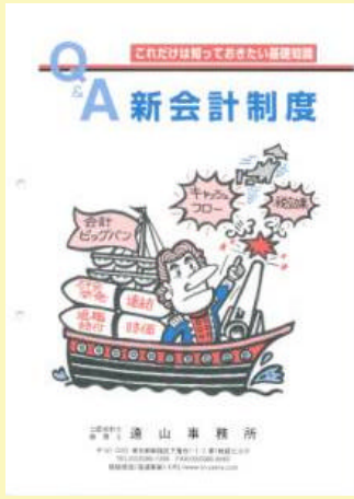
1 新会計制度 500円

遠山事務所が発行している本です 定価+送料200円で、お送りします。 電話でのご注文(振込)、又は希望書籍名と上記分の切手をお送り下さい。着金後発送します。(書籍担当:島崎、遠山)