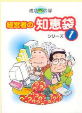
13 経営者の知恵袋 成功への扉 500円