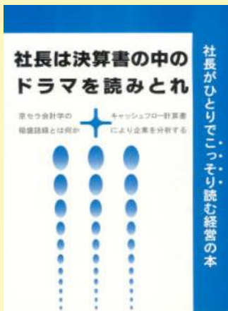
5 社長は決算書の中のドラマを読みとれ 500円