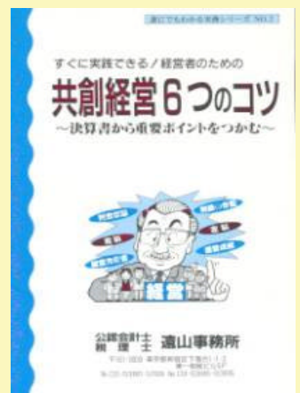
16 共創経営6つのコツ 500円