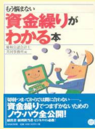
11 資金繰りがわかる本 1300円