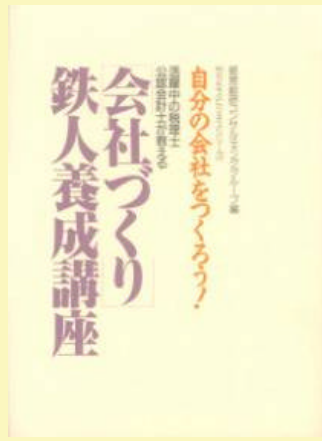
10 会社づくり 鉄人養成講座 1200円