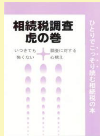
7 相続税調査 虎の巻 500円