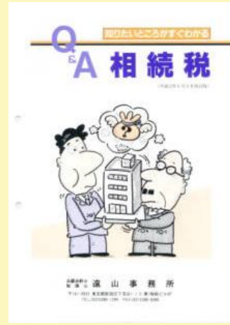
3 相続税 500円