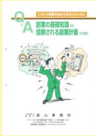
2 創業の基礎知識から信頼される創業計画づくりまで 500円