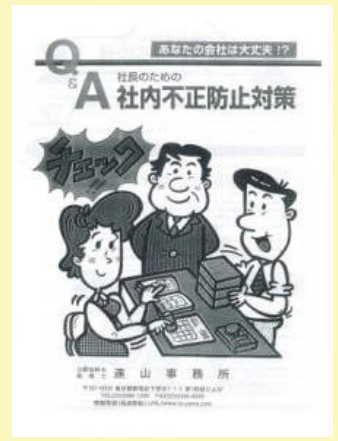
12 社内不正防止対策 500円