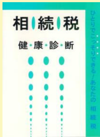
6 相続税 健康診断 500円