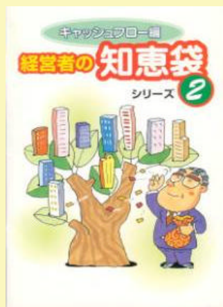
14 経営者の知恵袋 キャッシュフロー編 500円